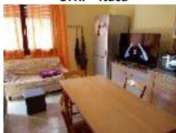
GAA "Via Trieste"