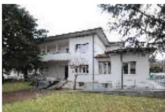
CA "Villa Chiara"