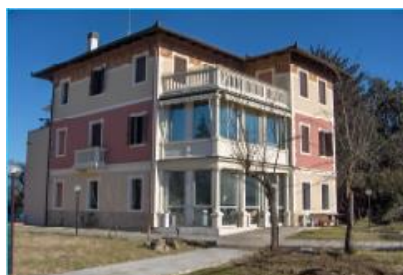
CTRP "Dina Muraro"