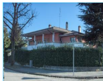
CTRP "Le Farfalle"