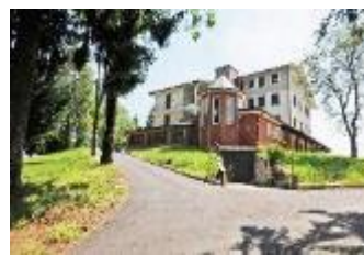
RSA "Villa S. Rita"