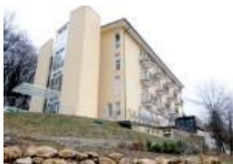
CA "Ancora Insieme"