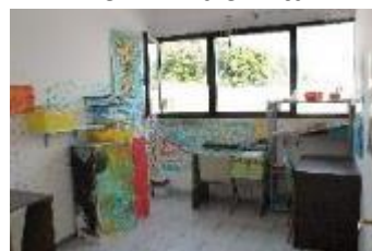
Centro Diurno MEA