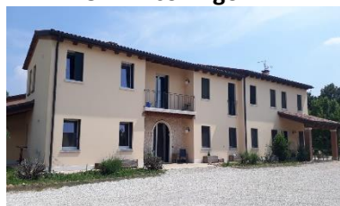
CA "La Collina"